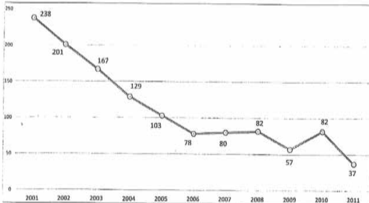
Comparativo de homicídios - Jan a Dez - 2001/2011 (Taxa p/100 mil/hab)