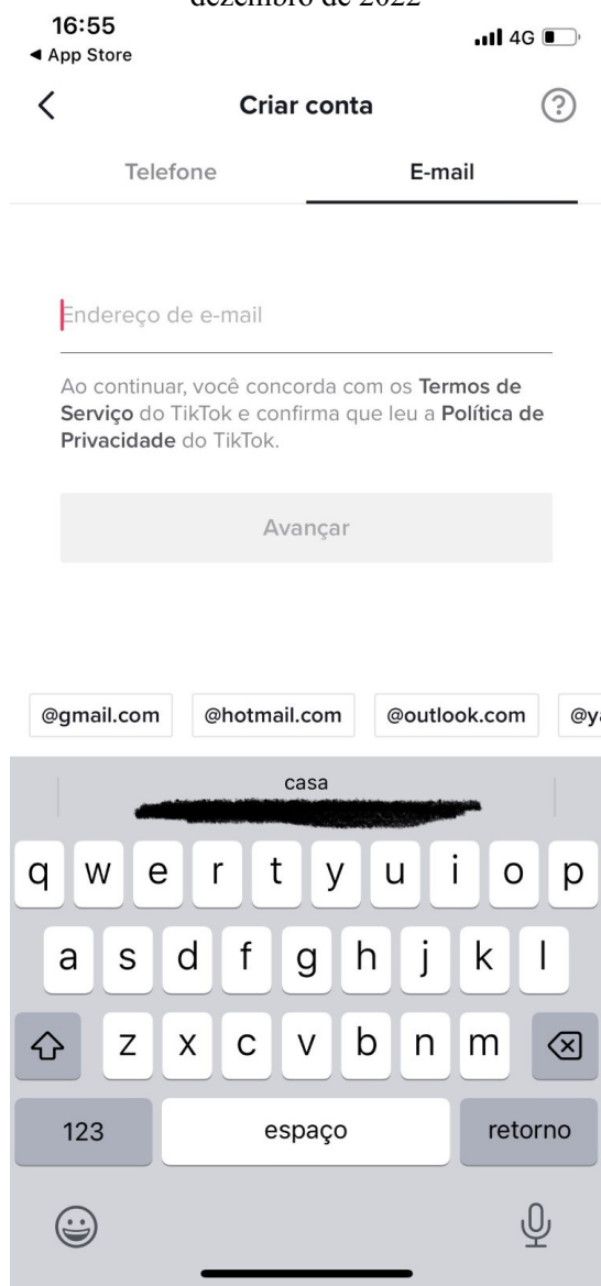
Figura 2 - Captura de tela de uma simulação de cadastro feita por servidor da CGF, por meio de aplicativo, em 20 de dezembro de 2022

5.44. Esta CGF, então, solicitou à ByteDance Brasil, por meio do ANPD - Ofício 3 (SEI nº 3856539), que confirmasse a alegação de que “se o usuário tiver 13 anos ou mais, o usuário deverá fornecer seu número de telefone celular”. A ByteDance Brasil, por meio da Petição Complementação de informações (SEI nº 3928741), de 31 de janeiro de 2023, afirmou então que o fornecimento do número de telefone é a opção padrão para efetuar o registro no TikTok e que o usuário precisaria clicar intencionalmente na aba “E-mail” para se cadastrar usando seu e-mail. Novamente, apresentou captura de tela semelhante à Figura 1. Contudo, em nova simulação feita por servidor da CGF, em 10 de fevereiro de 2023, por meio de aplicativo, constatou-se situação idêntica à de 20 de dezembro de 2022, mostrada na captura de tela da Figura 2, em que o e-mail é o padrão. Já em uma simulação feita por um navegador em um computador mostrou o telefone como padrão, conforme a Figura 3.